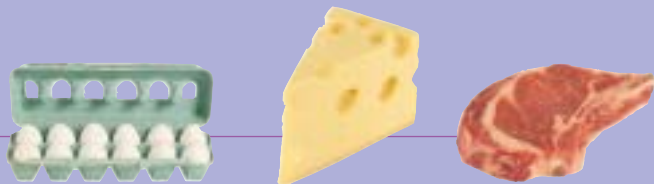
Falzett/ Greenpeace 1989